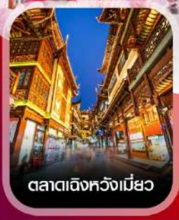
ตลาดเชิงหวังเมี่ยว